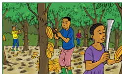
La récolte avec une machette ou une faucille