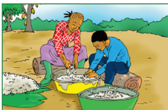
Laver les fèves, les fruits, les légumes, les tubercules.