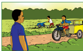
La conduite d'engins motorisés