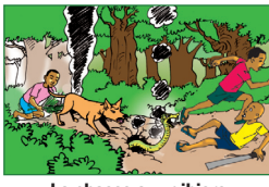
La chasse aux gibiers avec une arme