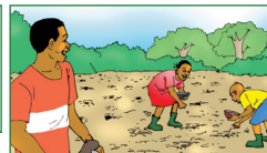
Semer des graines.