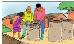
Tenir les sacs ou les remplir à l'aide de petits récipients pour le conditionnement des produits agricoles.