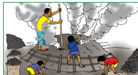
La production de charbon de bois