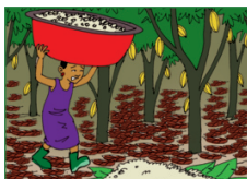
Le port de charges lourdes