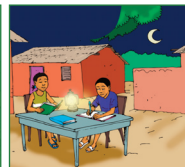
Etudier ses leçons