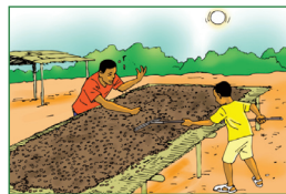
Trier et étaler les fèves, les céréales et autres légumes pour le séchage.