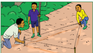
Aider à mesurer les distances entre les plants lors du piquetage.

Dans l'agriculture et la foresterie, les travaux légers sont :