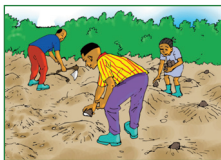
Déposer les boutures sur les buttes.