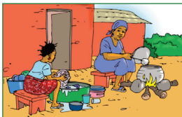
Aider les parents