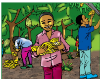
Ramasser et rassembler les fruits, les cabosses, les graines après cueillette.