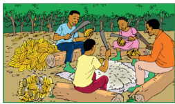
L'écabossage avec un objet tranchant