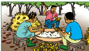
Extraire les fèves à la main après écabossage par un adulte.