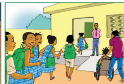
Être assidu et ponctuel à l'école