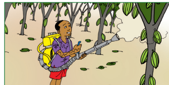
La manipulation de produits agrochimiques