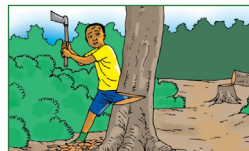
L'abattage des arbres